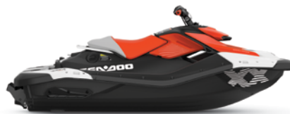
NOVO Vermelho Dragon e Branco Bright