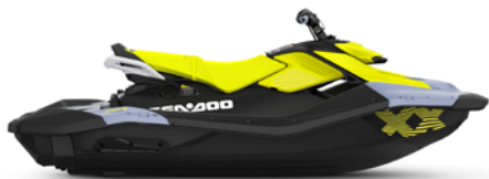
NOVO Azul Vapor e Amarelo Neon